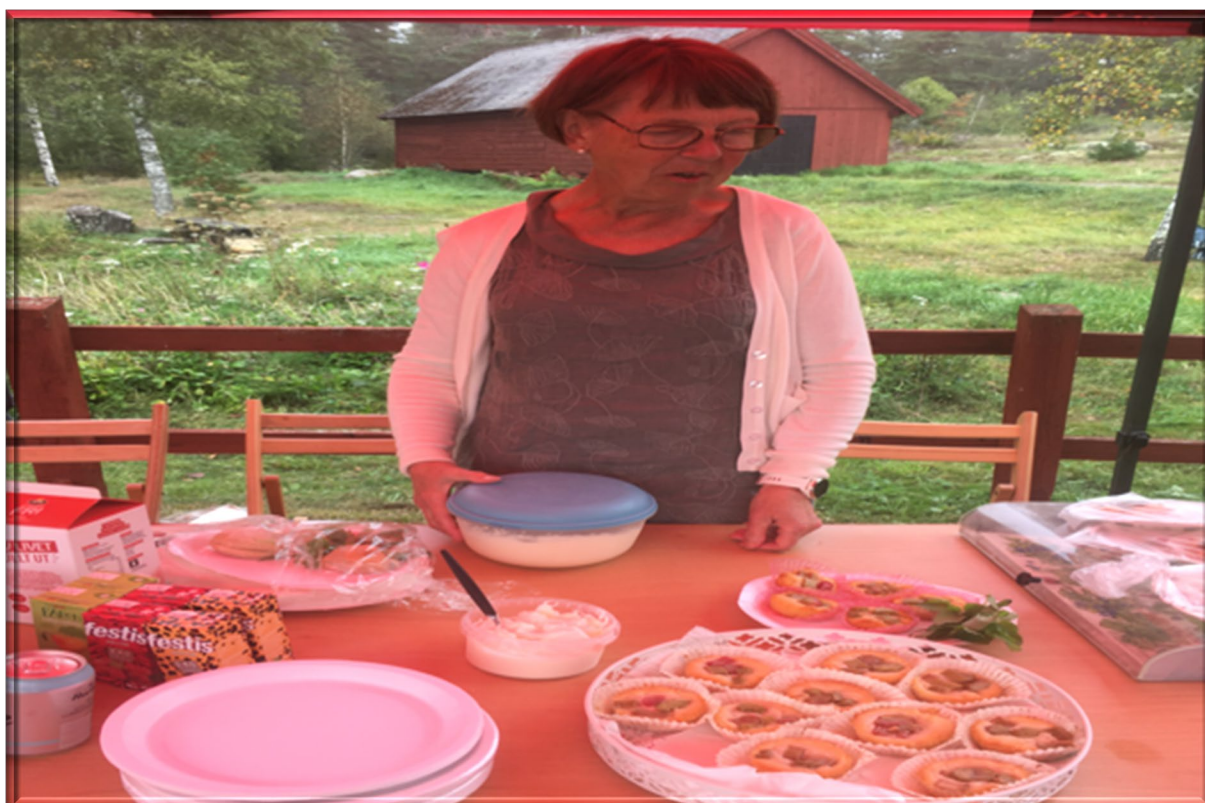
Årets Östgötakaka - rabarbermuffins.